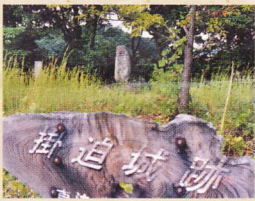
⑩掛迫城跡 福山市駅家町大字法成寺

全長四六・五mの前方後円墳。石室からは三角縁神獣鏡が出土している。五世紀の初め頃の築造。