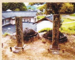
③門田朴斎の墓 福山市駅家町大字法成寺

門田朴斎は江戸時代末期に活躍した福山藩の儒学者で幕末の英主、阿倍正弘の教育にあたった人。