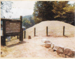
⑬猪の子古墳 福山市加茂町大字下加茂

工事に伴い発見、調査された古墳が移築・保存されている。竪穴式石室や横穴式石室を見学可能。