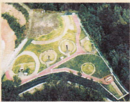
⑪粟塚古墳の丘 福山市駅家町大字法成寺

掛迫城は戦国時代の領主宮法成寺氏の山城。標高は約一〇〇mで登り易く、郭跡もきれいに残されている。