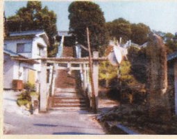
⑦法成寺八幡神社 福山市駅家町大字法成寺

広島県では最も古い横穴式石室のひとつと考えられている古墳。馬具や装身具・須恵器などが出土。