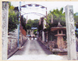
④須佐能表神社 福山市駅家町大字法成寺

門田朴斎は江戸時代末期に活躍した福山藩の儒学者で幕末の英主、阿倍正弘の教育にあたった人。