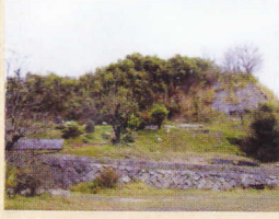
⑧小糸城跡 福山市駅家町大字法成寺

十月の例祭のとき、荒米の粉を水と油でねって作った「おまがり」を供える特殊神事で知られている。