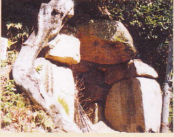
(ロ)土井の塚古墳 福山市駅家町大字法成寺

花崗岩の巨石を用いた横穴式石室の一部のみ残る。銅鏡・馬具などが出土。六世紀末ごろの築造。民家の敷地内にあるので、見学する際には了解を取ってください。