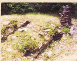
⑨掛迫第6号古墳 福山市駅家町大字法成寺

小糸城は北東の掛迫城と関連が深かった城館で、丘陵の先端に築かれた宮法成寺氏の居館跡。