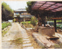
⑤門田屋敷 福山市駅家町大字法成寺

中世、法成寺で疫病が流行したさい、新市町戸手の牛頭天王社からスサノオの分霊を勧請して創建された。